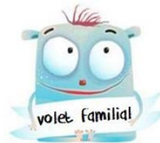
Neurone Scientifique SP